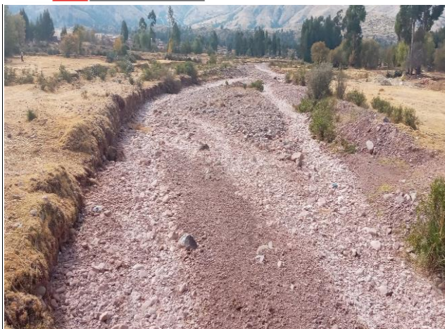
FOTO 03: Aguas abajo del puente seccion hidraulica variable y cauce colmatado requiriendo la limpieza y descolmatacion para vitar la erosion.