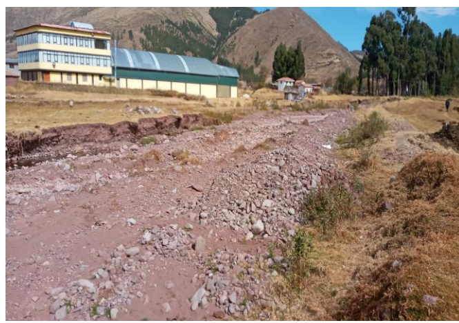
FOTO 04: Se aprecia viviendas asentadas proximos a las riberas de la Quebrada Challamayo.